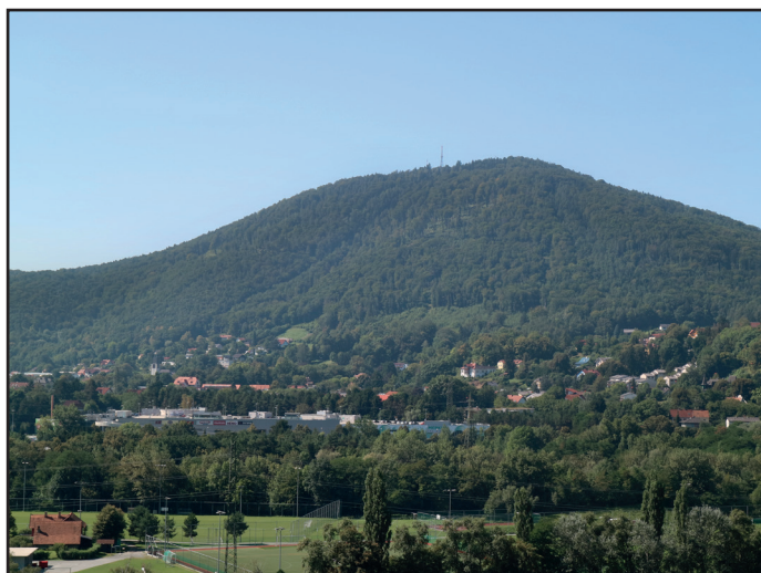
Stadt Graz verzichtet auf 20 Hektar Wald am Plabutsch.

Der gewaltige Haken dabei: Rund 20 ha – eine Fläche, die fast so groß ist wie der Schloßberg und der Augartenpark zusammen, werden im Zuge dieses „Tauschs“ um rund 500.000 Euro an Helmut Marko verkauft. Das Geld will Bürgermeister Nagl in die von ihm ausgerufene „Grünraumoffensive“ investieren. Doch wie viel Grün bekommt man in Graz für 500.000 Euro? Zum Vergleich: 2010 hat die Stadt Graz im Bezirk Jakomini ein 18.000 Quadratmeter großes Grundstück, das Areal des ehemaligen Grazer Sportklub Fußballplatzes, an den Medienkonzern Styria verkauft. Auf einem Teil des Grundstückes wurde des Styria-Headquarter er-