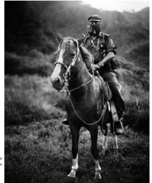
Unterkommandant Marcos

antimonopolistische Entwicklungswege. Das 21. Jahrhundert wird zum Jahrhundert eines neuen Aufschwungs der revolutionären Bewegung und einer neuen Serie von sozialen Revolutionen in der Welt.