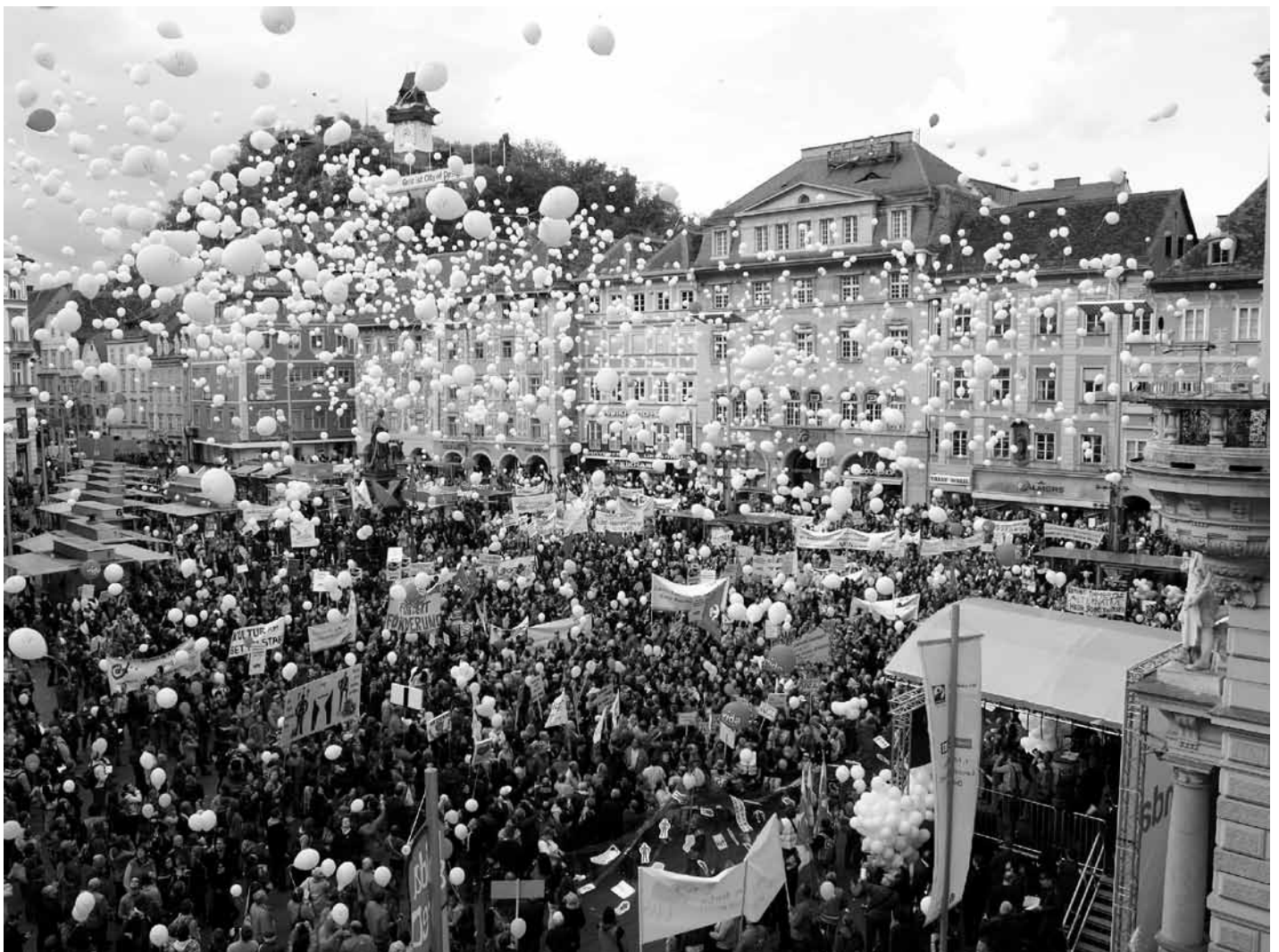
26.04.2011: 15.000 Menschen folgen dem gemeinsamen Demonstrationsauftritt von ÖGB und Plattform 25.

sen, findet der ideologische Kampf um die Interpretation der Krisenursachen statt. Die Interpretation entscheidet über das Wollen und Tun der Menschen, auch was die Suche nach Auswegen aus der Krise und die Akzeptanz von Lösungen betrifft. Heute erfolgreich gegen die Krise zu kämpfen setzt voraus, den Menschen zu helfen, die Welt zu verstehen und auch zu verstehen, dass die Aufgabe der Mainstream-Medien in der Anti-Aufklärung, in der Täuschung und Ablenkung von den wahren Zusammenhängen besteht. Wirklich revolutionär Handeln heißt dem doppelten Anspruch zu genügen, die „Welt zu interpretieren“ und „zu verändern.“ Wer die Welt nicht versteht, kann sie auch nicht verändern. Wer im Klassenkampf um die Interpretation der Begriffe siegt, hat auch die Chance den Sieg im Kampf um die Hegemonie in der Gesellschaft. Ein „Zurück“ zum bereits in den 70er-Jahren gescheiterten Keynesianismus, bloß zu massiven Konjunkturprogrammen, wird ebenso wirkungslos bleiben wie die eine oder andere Regulierung der Finanzmärkte. Genauso könnte man einen Krebskranken mit Hustenbonbons zu heilen versuchen.