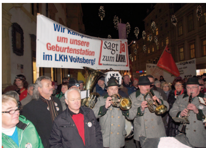
Entschlossener Einsatz der Voitsberger Bevölkerung für ihre Geburtsstation – Landesrätin Edlinger-Ploder ließ sich aber nicht vom Zusperrern abhalten.

nach Graz ausgesprochen hatte: „Was hier mit unseren Spitalern geschieht, stellt einen Eingriff in das öffentliche Gesundheitswesen dar, wie es ihn in der Geschichte der Zweiten Republik noch nie gegeben hat. Ob in Voitsberg oder in Graz, die Menschen haben mit tausenden Unterschriften gezeigt, dass sie mit dieser Politik nicht einverstanden sind. Die Regierung wäre gut beraten, die Bevölkerung ernst zu nehmen und die Signale zu hören, die sie ausgesendet hat.“