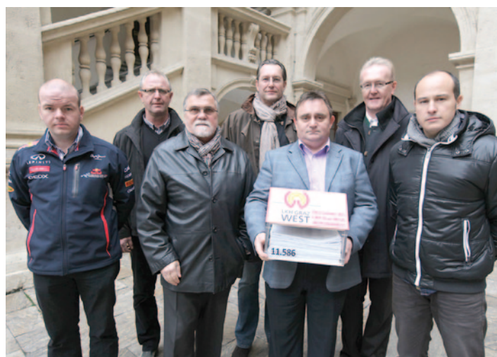
Der Betriebsrat des LKH West überreichte 11.500 Unterschriften gegen die Privatisierung des zweitgrößten steirischen Spitals.