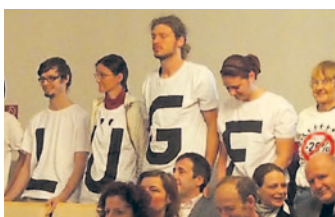
Protest im Landhaus gegen die Kürzungspolitik von SPÖ und ÖVP.